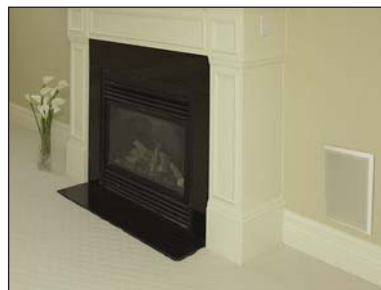
SUBWOOFER CON REJILLA EMPOTRADO EN LA PARED