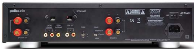
SWA500 (por delante)