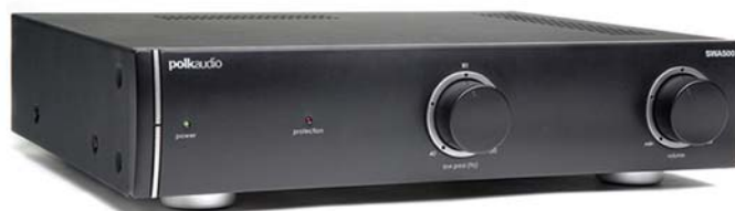
SWA500 (por atrás)