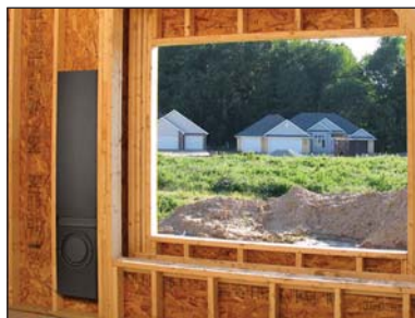
CABE ENTRE LOS PARALES VERTICALES ESTÁNDAR CON 16 PLG. DE SEPARACIÓN DE CENTRO A CENTRO

VEA LAS ESPECIFICACIONES PARA OBTENER INFORMACIÓN MÁS DETALLADA SOBRE EL PRODUCTO.