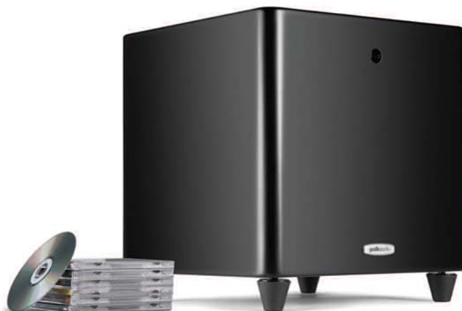
DSW PRO 400