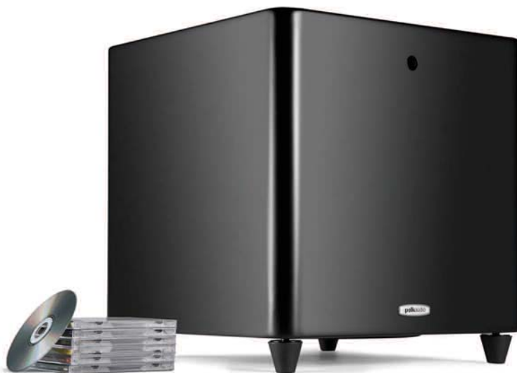
DSW PRO 600