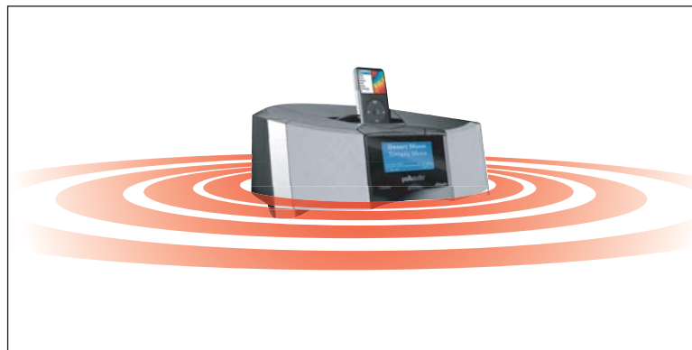
CONFIGURATION 4 HAUT-PARLEURS I-SONIC ES2