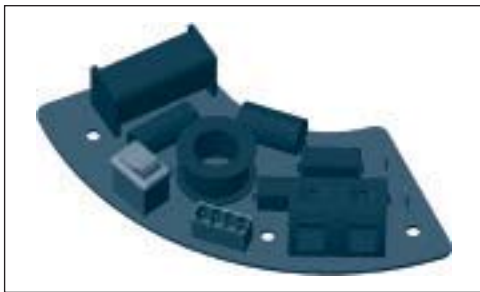
SC85-IPR 및 SC80-IPR 스피커 들은 스위치의 방향을 바꾸는 순간 스탠더드에서 IP-레디로 갑니다.

2개의 모델 모두에는 재래 시스템을 위한 표준 스피커 와이어 입력과 IP 사용을 위한 유럽 스타일의 단자가 있습니다. 로커 스위치로 설치자가 설치에 적합한 입력을 선택할 수 있습니다.