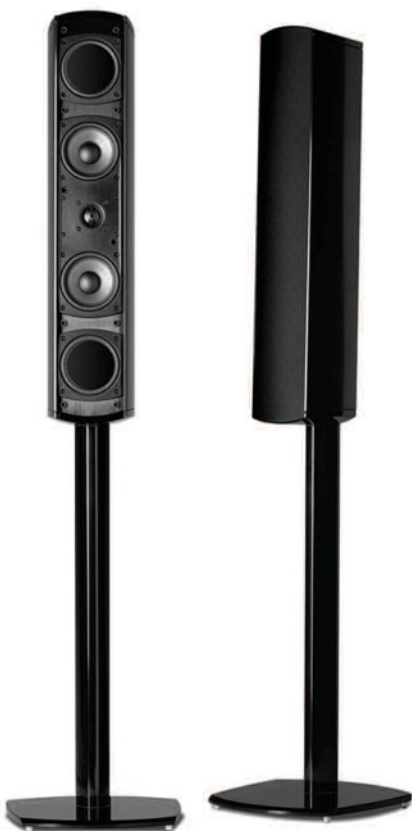
VM20 (BASE DA PAVIMENTO OPZIONALE)