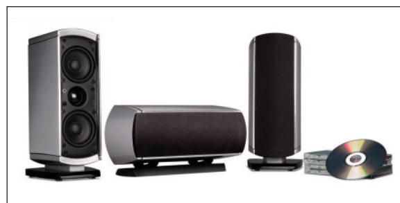
VM10 (DIFFUSORI SX/CENTRALE/DX)