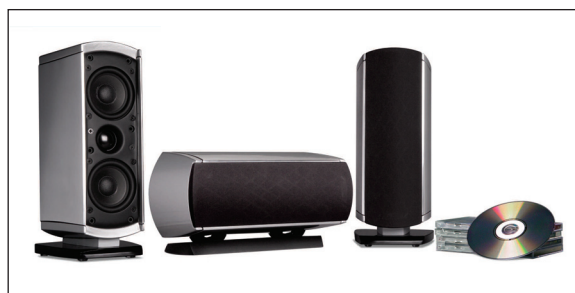
VM10 (MOSTRADA COMO UNIDADES ESQUERDA/CENTRAL/DIREITA)